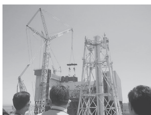
事故当時のガレキが今も残る1号機を見学