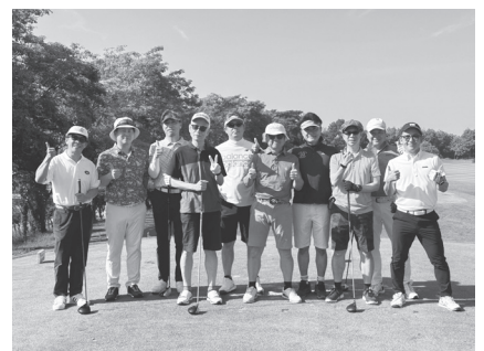
懇親ゴルフ会にて