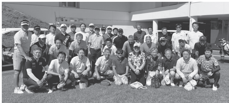
■全特協懇親ゴルフコンペ上位成績