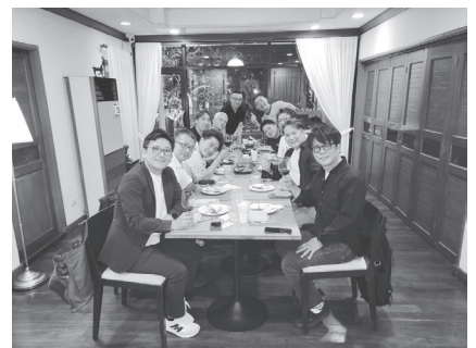
ビジネスサミットで親睦を深めた