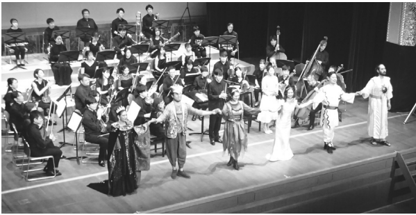
オペラの華やかさと子供たちの笑顔に包まれたコンサート