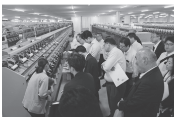
撚糸機20台を備えた大規模な工場を見学

製品を「双葉ブランド」として海外発信し、地元からの新卒採用にも力を入れるなど、同社の復興への思いが感じられる見学となった。