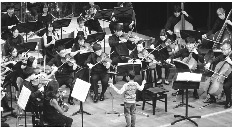
毎年恒例の子供たちによる指揮者体験コーナー

恒例の「指揮者体験コーナー」では、来場した子供たちが次々と舞台上昇って指揮にチャレンジ。会場からは大きな拍手と歓声が送られ、笑顔あふれるひとときとなった。