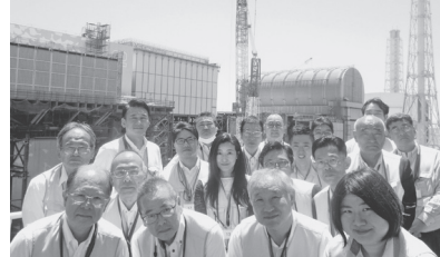
原子炉建屋4機を見下ろす見学デッキにて