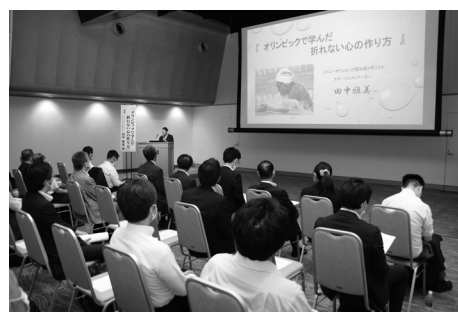
テレビでも活躍中の講師は話術も巧みで会場は明るい雰囲気に