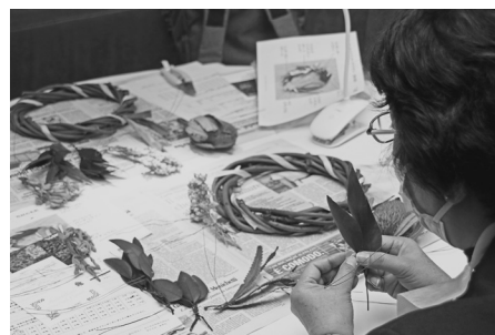
かわいいだけのアレンジメントではなく野性的な魅力も追求する製作