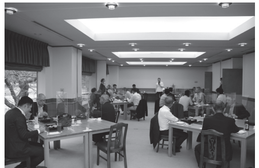
成績発表会を兼ねて懇親会もおこなわれた